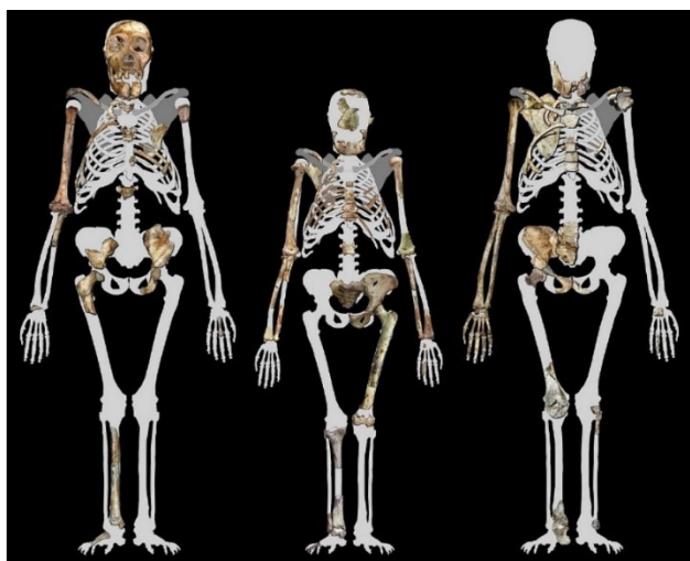
Abb. 2 Die beiden Skelettfunde von Australopithecus sediba (rechts und links) haben einen affenartig nach oben verengten Brustkorb – ebenso wie „Lucy“ ( Australopithecus afarensis ) in der Mitte.

Auch der Fuß ist ganz anders gebaut als beim Menschen und „überwiegend großaffenähnlich strukturiert“, weil er auf gute Kletterfähigkeit und eine äußerst schlechte Kraftübertragung beim aufrechten Gehen hinweist. 2 Die genaue Fortbewegungsweise des Australopithecus sediba ist aufgrund fehlender Analogien bei heutigen Affen kaum zu rekonstruieren. Die Kletteranpassungen sind eindeutig, sodass er sich wohl hauptsächlich auf Bäumen fortbewegte. Ein aufrechter, aber nicht menschlicher Gang über kurze Strecken ist denkbar. Der Fuß hatte keinen guten Bodenkontakt und der affenartige Brustkorb und das hochgelegene Schulterblatt hätten kein effektives Atmen oder Armschwingen beim Laufen erlaubt. 2 Manche Forschern schlagen sogar eine schnelle vierfüßige Fortbewegung vor. 2