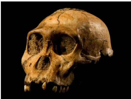
Abb. 1 Der Schädel von Australopithecus sediba (MH1)

Insbesondere der berühmte „ Australopithecus sediba “ aus Südafrika wird seit seiner Veröffentlichung im Jahr 2010 immer wieder als Vorfahr des Menschen diskutiert. Tatsächlich hat er einige menschenähnliche Merkmale an Schädel und Gebiss, wie zum Beispiel weniger abstehende Wangenknochen. 1 Dennoch gilt, dass Australopithecus sediba „die meisten Gemeinsamkeiten“ mit Australopithecus africanus „hinsichtlich Schädelform, Gesichtsschädel, Unterkiefer und Zähnen teilt“. 1 Auch der Unterkiefer wird als ähnlich zu anderen Australopithecus -Arten aus Südafrika beschrieben. 2 Außerdem bestreiten die Wissenschaftler